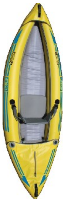
AE Attack Whitewater