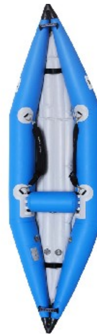
Aquadesign K Air 3.00