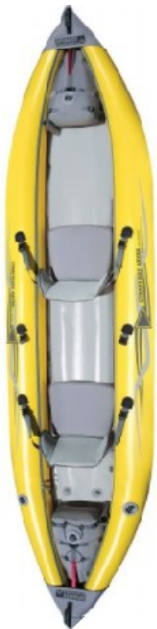
AE Straitedge 2