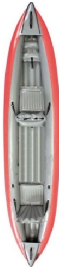
Gumotex Solar 410