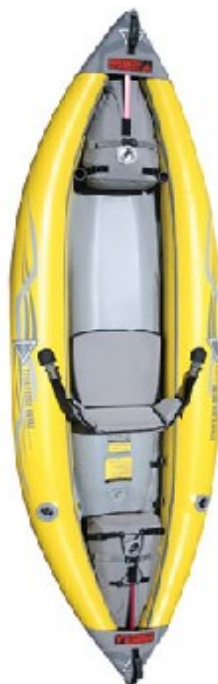
AE Straitedge 1