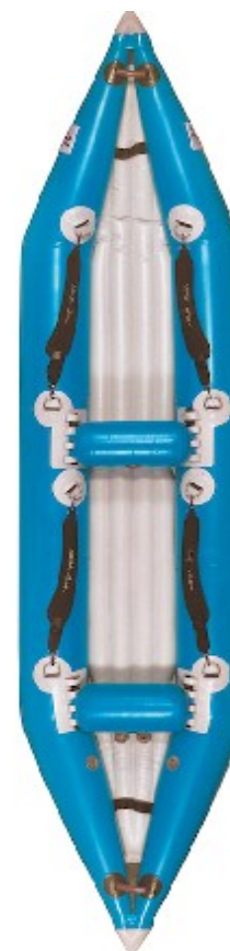
Aquadesign K Air 3.80