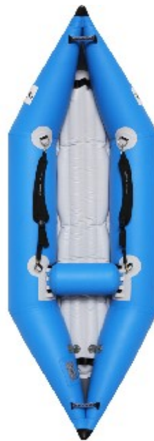
Aquadesign K Air 2.80