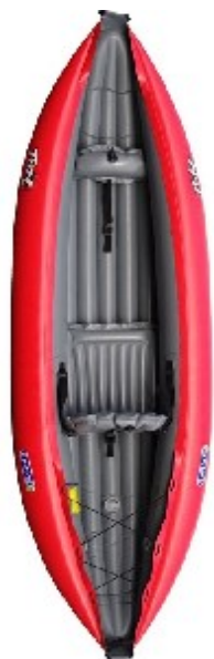
Gumotex Twist 1