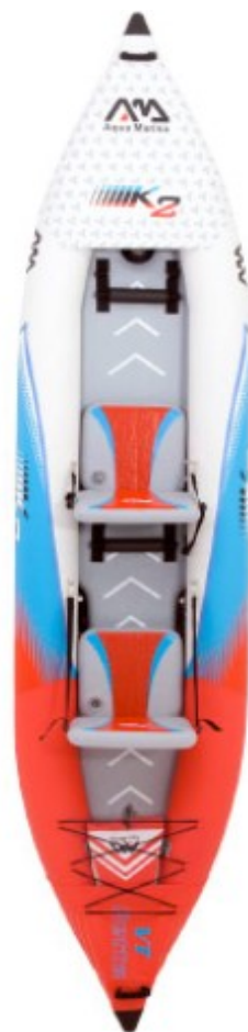
Aqua Marina VT K2 3.12