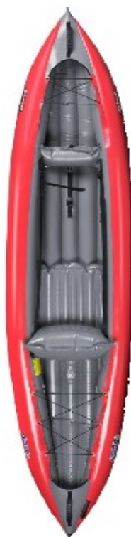
Gumotex Safari 330 xl