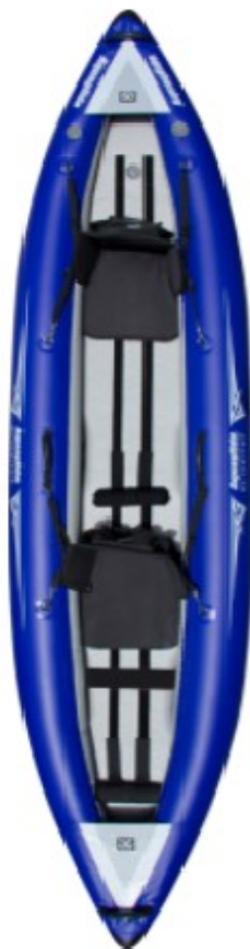
Aquaglide Klictitat 2