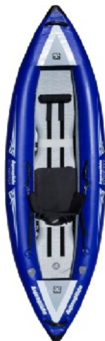
Aquaglide Klictitat 1