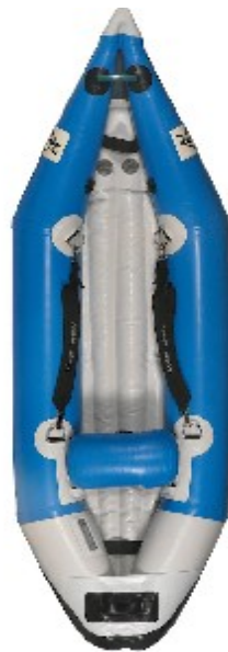
Aquadesign K Air 2.60