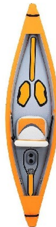
Aqua Marina Tomahawk