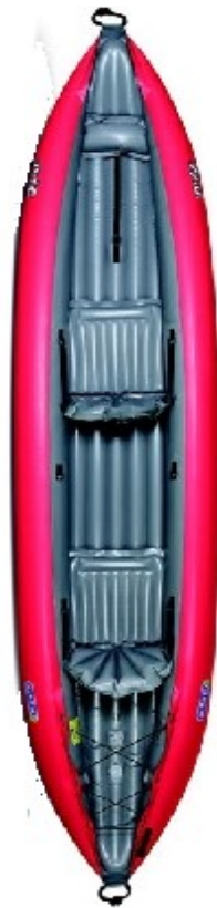
Gumotex Twist 2