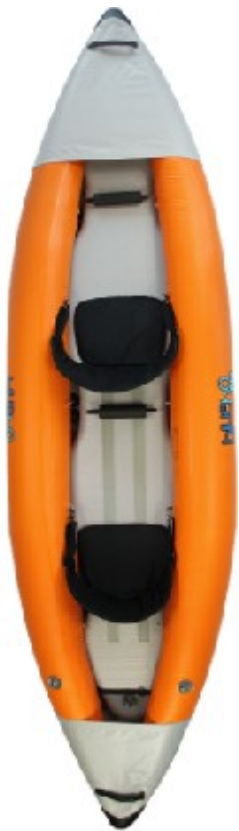
Blueborn SKX 200