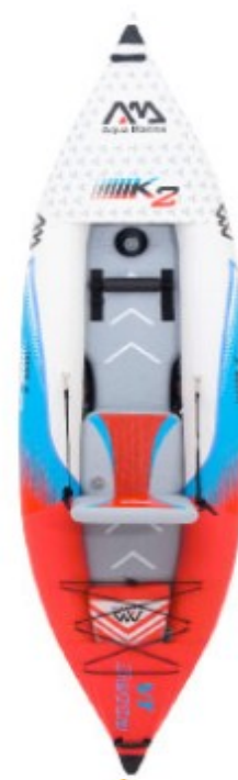
Aqua Marina VT K2 3.12