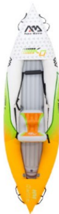
Aqua Marina HN K0 3.12