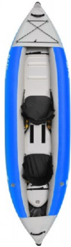
Zpro Flash 200