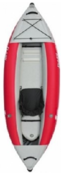
Zpro Flash 100