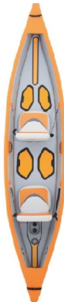
Aqua Marina Tomahawk 13.11