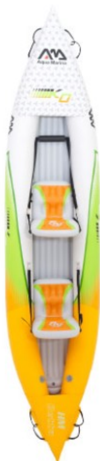
Aqua Marina HN K0 3.12