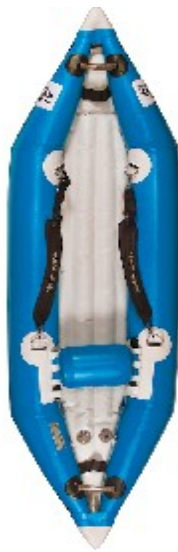
Aquadesign K Air 2.40